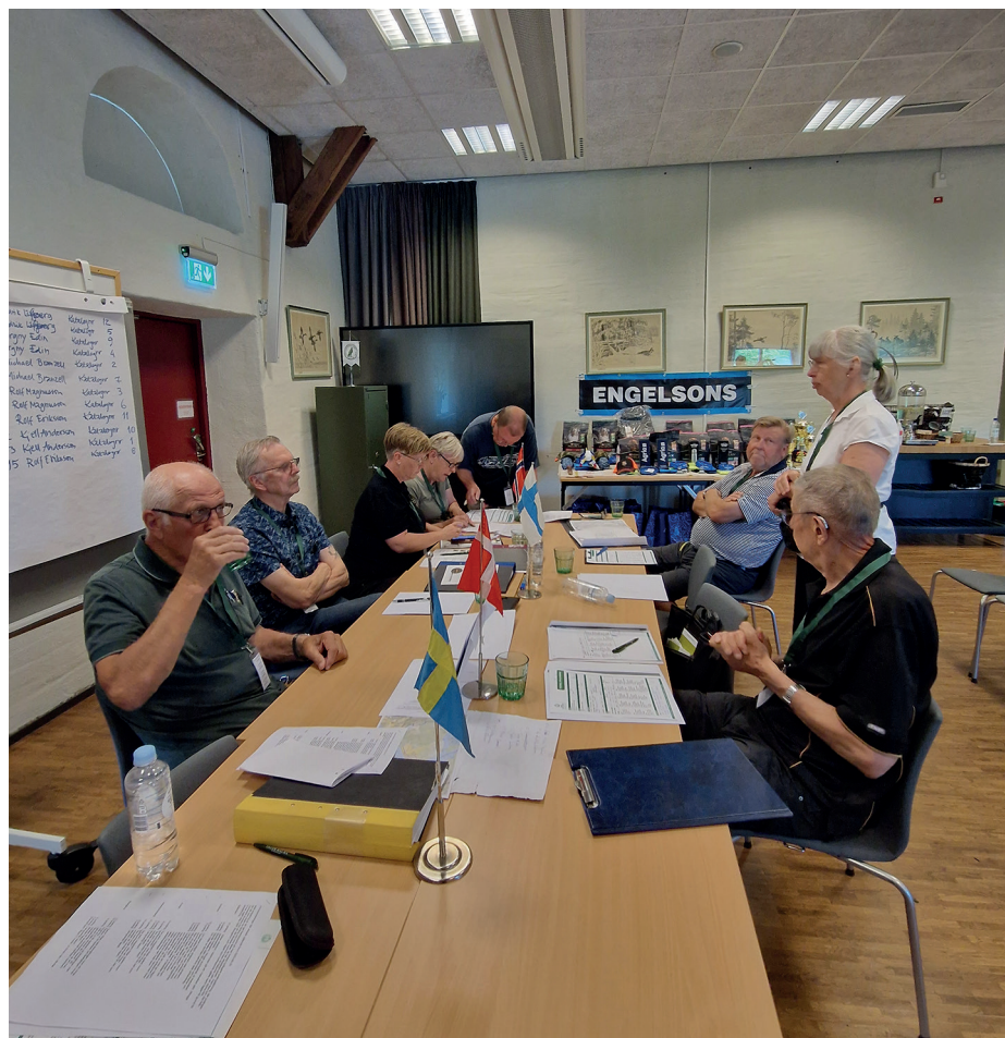
Dommerkollegiet brugte et par timer på grundigt at diskutere bedømmelser og placeringer. (Foto: Barbro Zetterberg)

Lørdag den 1. juni kl. 9 var der afgang til sporet. Vi fulgte Michael på en kort køretur ud i skoven. Vi standsede på en grusvej med et større, åbent areal på højre side og tættere bevoksning samt en stejl skråning til venstre, som var der, hvor spor 5 var udlagt. Vi fik tilbudt myggebal-sam, bedt om at tage en langærmet bluse på samt kasket. Alt dette gav rigtig god mening, da der sværmede med myg, som udviste stor interesse for os. Det var meget varmt, 25-27 grader, let vind og skyfrit. Jeg havde en termokande med vand og godbid til hunden i en rygsæk.