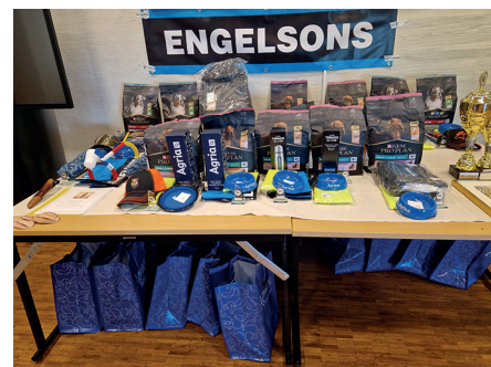
Arrangørerne havde skaffet en masse anvendelige sponsorpræmier.

Det hele tegnede meget pænt. Ventetiden frem til parolen blev nogle interessante timer. Vi havde jo klaret det fint, og kunne nyde den helt fan-