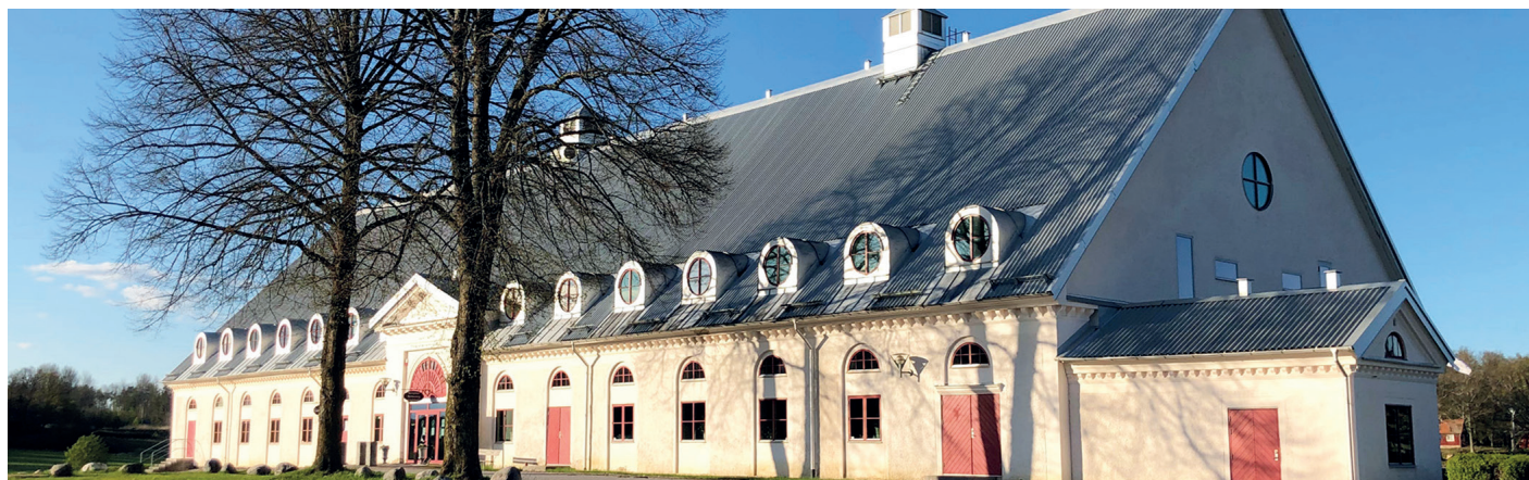
Den gamle lade er omdrejningspunktet for jægerforbundets drift i dag.

Er du nysgerrig på Öster Malma og alt, hvad det har at byde på? Et godt sted at begynde er med at besøge deres hjemmeside ostermalma.se . Hjertelig velkommen til Sverige og Öster Malma!