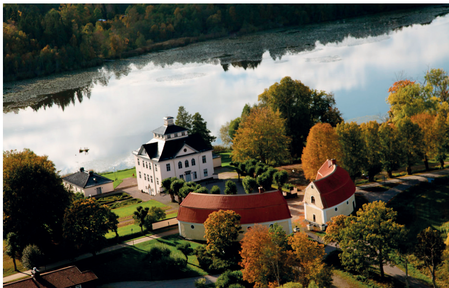
Det charmerende barokslot Öster Malma med de to, karakteristiske fløje ligger ved bredden af Malmasøen i Södermanland.

Efter flere ejerskifter fik det svenske jægerforbund i 1947 mulighed for at forpagte Öster Malma med henblik på uddannelse i jagt og vildtpleje. I 1994 købte jægerforbundet hele god-