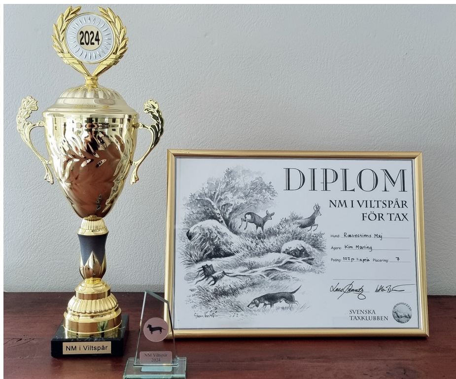
Der var en erindringsgave og et flot diplom til alle deltagere. Den store NM-pokal til vinderholdet var det derimod kun danskerne, der fik med hjem.

afsted. Det er et minde, man kan leve højt på i mange år, især når man møder så mange glade mennesker, der brænder for jagt og aktiv brug af gravhunden.