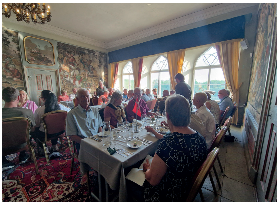
Om fredagen var der middag på slottet.