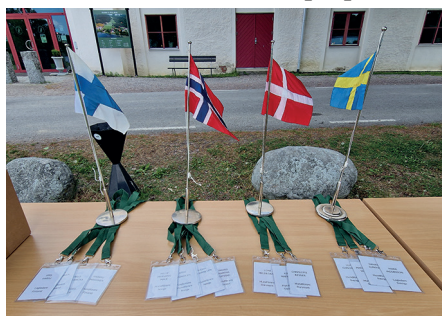
Ved indcheckning blev der udleveret navneskilte til alle deltagere.

rede: 'Det her bliver varmt og svært med "brændte" spor'. Men spændende var det også at møde de andre. Der var en hjertelig velkomst fra Södermanlands Taxklubb, hvor vi blev udstyret med kasketter og navneskilte. Desuden skulle hundene på bordet til chip-, pas- og stambogskontrol. Dernæst var der lodtrækning, hvor man blev sat sammen i de små hold, vi skulle være i til selve sporprøven